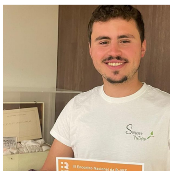
Prémio R-VES Santander 2023 (1º Lugar).