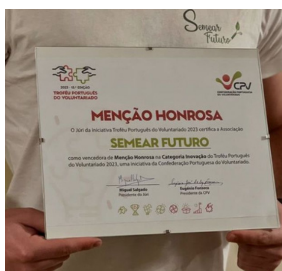
Menção Honrosa 2023 Troféu Português do Voluntariado.