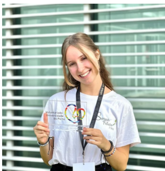
Prémio Voluntariado Porto 2022 (3º Lugar).