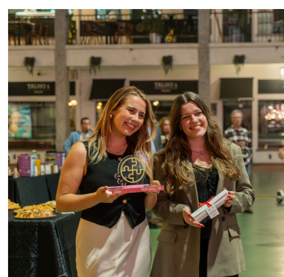
Vencedor Categoria Jovem 2024 Troféu Português do Voluntariado.